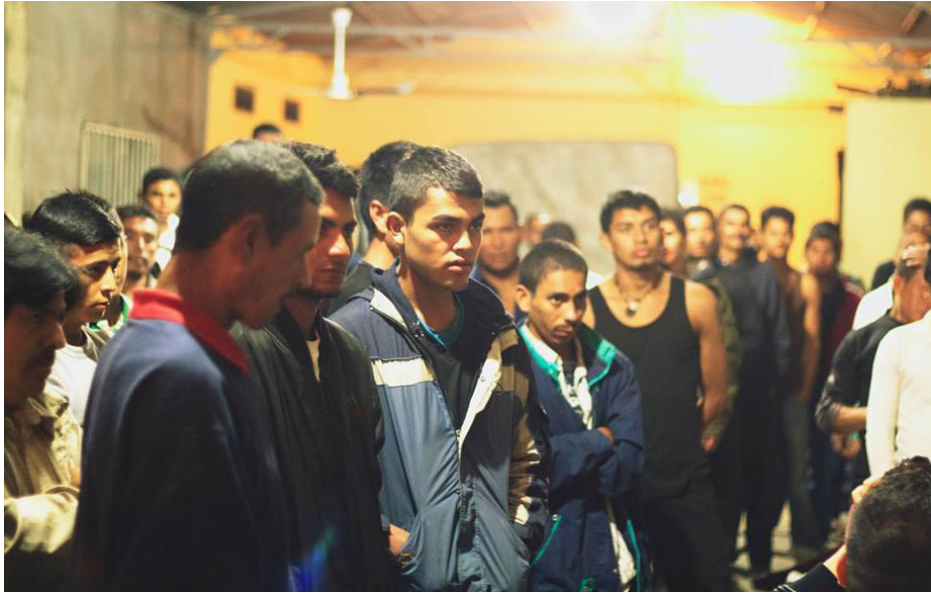
El registro de migrantes