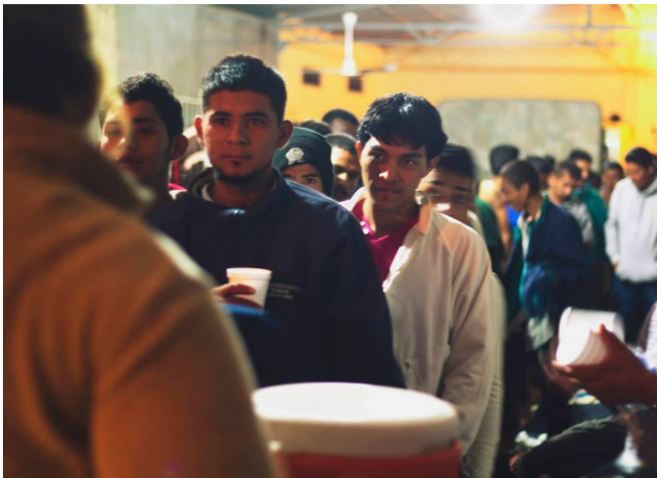
Migrantes centroamericanos escuchando las reglas de la casa del migrante en voz de "doña Bety"