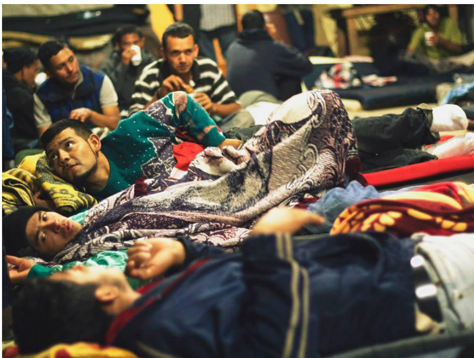
Migrantes hacinados ❖ Fotografía Eleazar Almeida