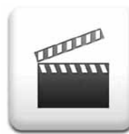
Video de Ponencias